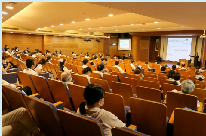
同仁全神貫注聆聽講師分享