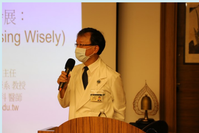
李毅醫秘開場致詞