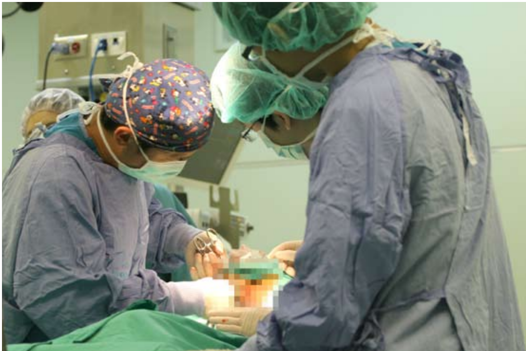
■ 大腸直腸外科不斷研發侵入性最低、降低疼痛的術式。圖為花蓮慈院大腸直腸外科正進行「痔瘡環狀切除手術」處理嚴重痔瘡，能有效降低疼痛，且能降低痔瘡復發率。

「痔」的問題嗎？當然不是。雖然痔瘡以及肛門瘻管等疾病的治療，能讓病患的生活品質大幅提升、甚至很快回歸正常，但大腸直腸外科處理的疾病就如同科名一樣，從大腸至肛門這段消化系統裡的問題，都是他們專門處理的強項。而其中，大腸癌，是病人上門來尋求協助的一大病症。