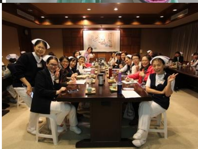
左圖：護理主管把握時間就各院護理實務經驗分享交流。