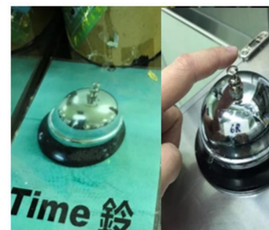
「指差」落實time out作業流程