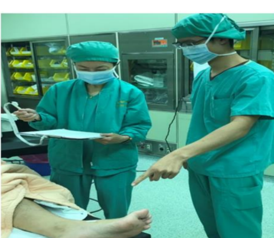
「指差」落實手術標示部位