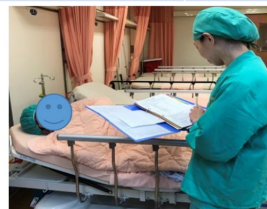
落實辨識單與同意書作業流程