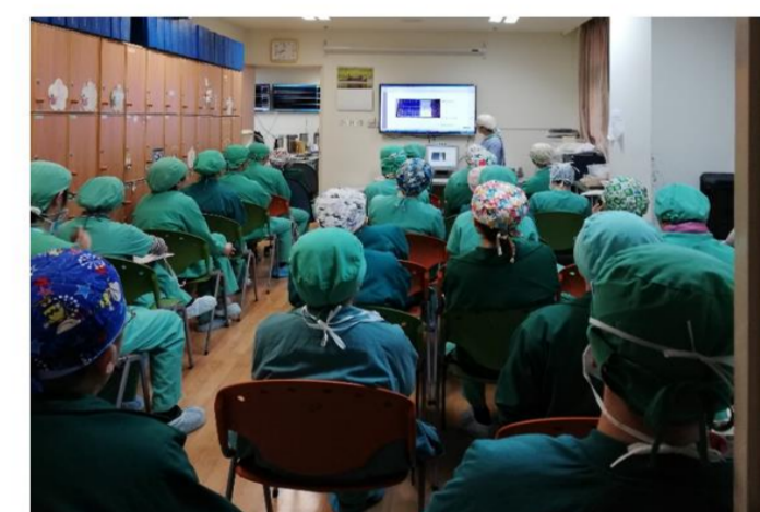
在職教育訓練/品管會議改善