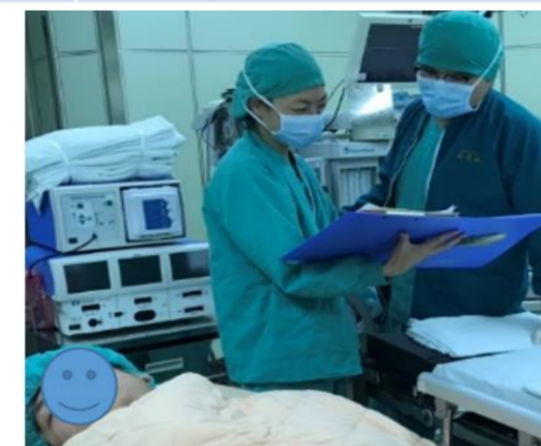
落實麻醉誘導前再確認作業流程