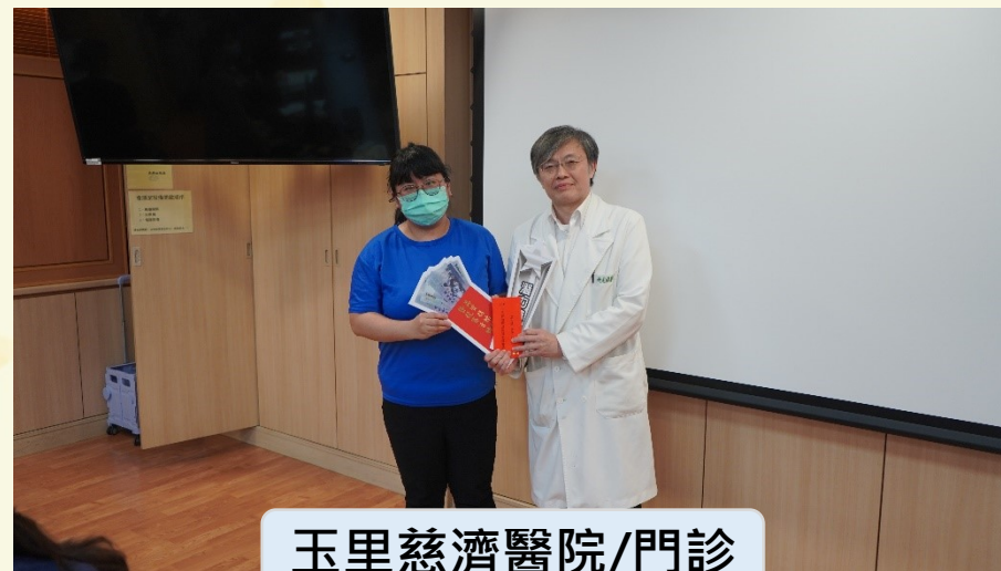
玉里慈濟醫院/門診