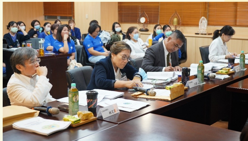
評審委員全神貫注聆聽團隊發表