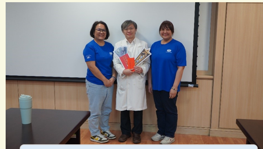
玉里慈濟醫院/護理科急重症急診