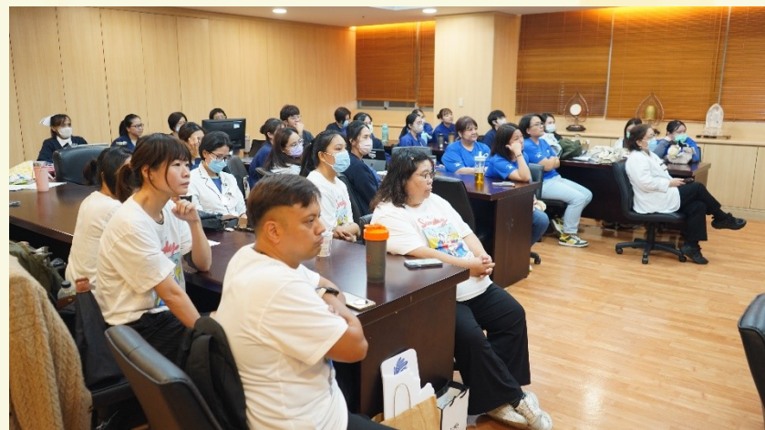
各單位部門同仁 一起參與瞭解品質改善