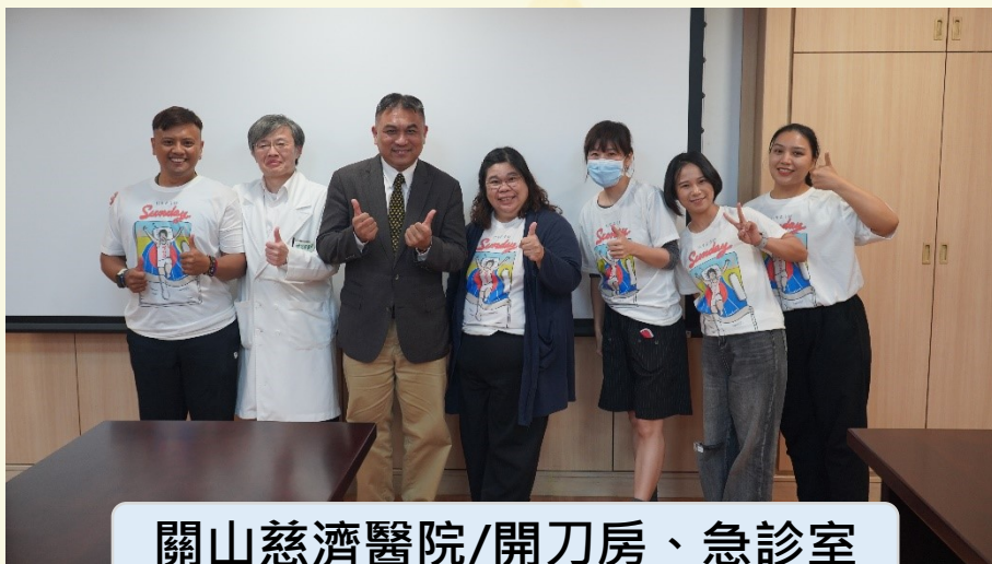
關山慈濟醫院/開刀房、急診室