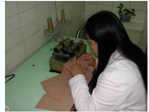
依版模取樣縫紉製作