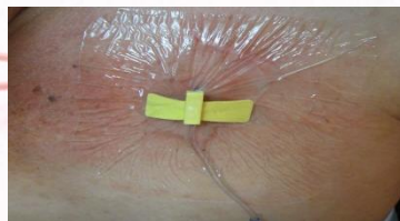
施打人工血管外觀