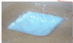
手術後傷口覆蓋防水透明膜

手術後 手術後皮膚外觀約有3~5公分的傷口，7天內傷口上會覆蓋美容膠及防水透明膜，需保持乾燥；手術一周後，傷口癒合，就不需換藥消毒可沖澡、泡澡或游泳；若傷口有紅、腫、熱、痛，須立即返診。