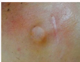
人工血管植入後外觀